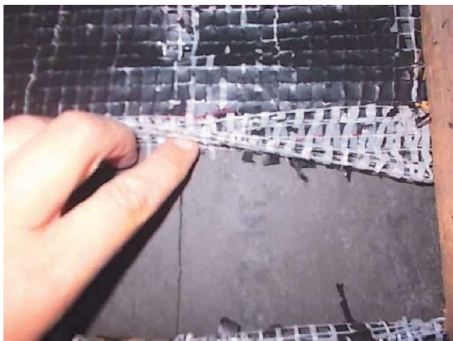
Grenier dépendance : Couverture du pan de toiture coté rue en ardoises composites sans amiante, marquage NT lu en sous face sous la toile