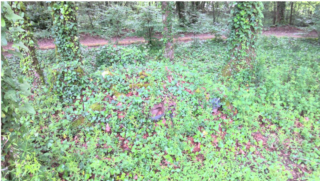
Jardin - Stock de bois non visité