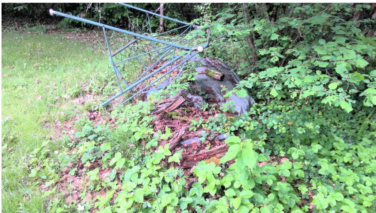
Jardin - Stock de bois non visité