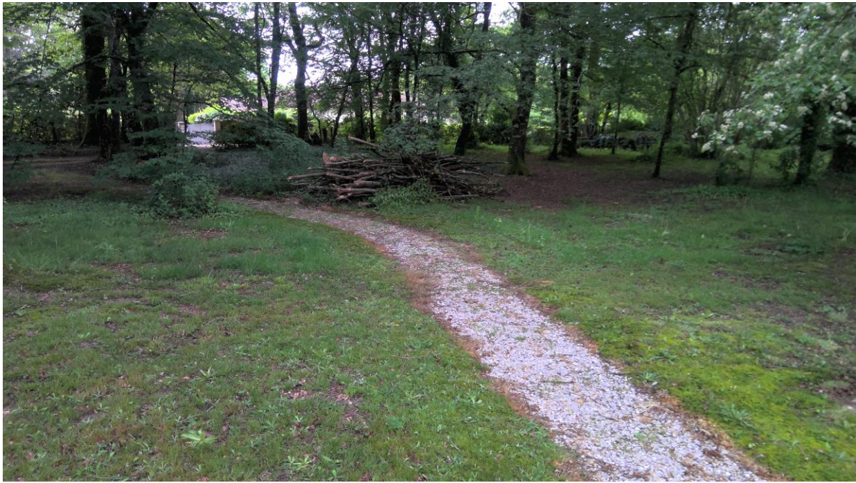
Jardin - Stock de bois non visité