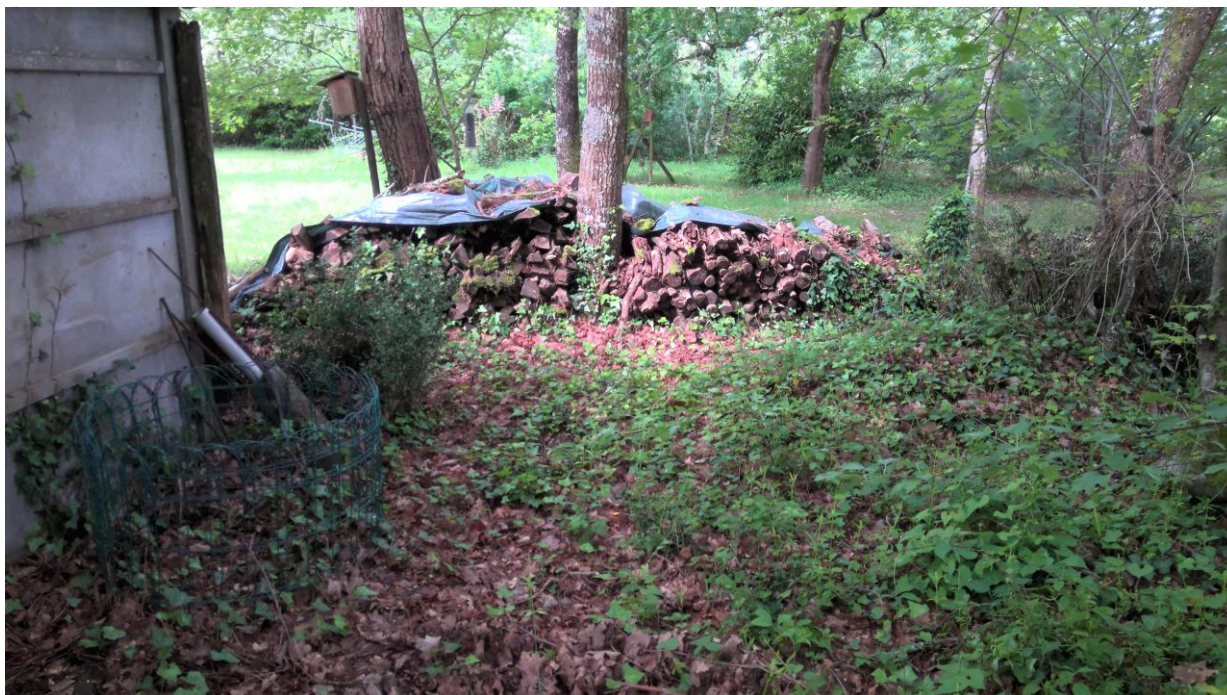
Jardin - Stock de bois non visité