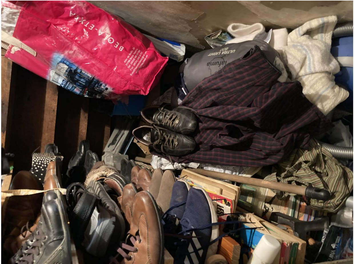
Placard sous escalier encombrement trop important