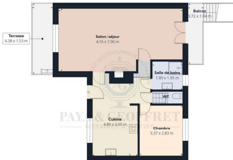
Niveau 1 Bâtiment 1