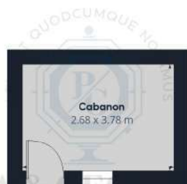
Niveau 0 Bâtiment 2