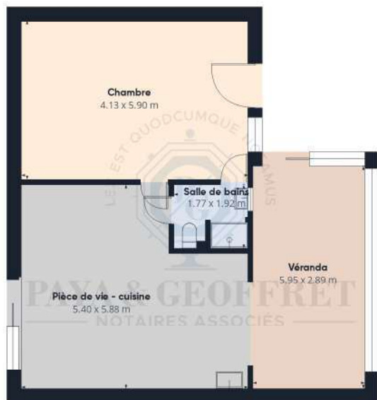
Niveau 0 Bâtiment 1