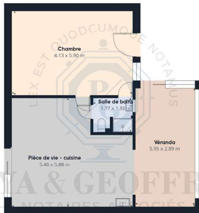
Niveau 0 Bâtiment 1