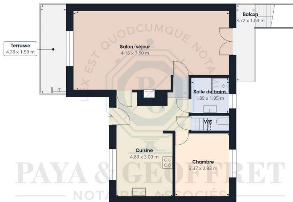
Niveau 1 Bâtiment 1